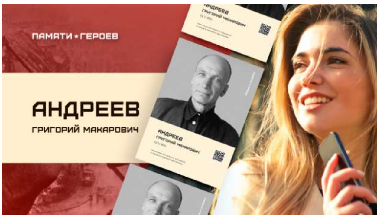
Рис. 3. Образец превью на загружаемый ролик о Герое. Шаблон .psd во вложении.