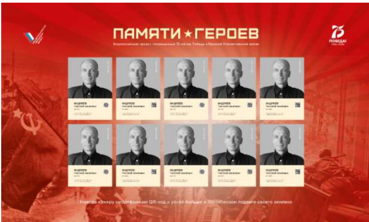
Рис. 5. Тематический стенд, на котором ежемесячно обновляется информация о героях